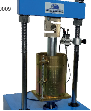
HR-AS0500/1 & HR-G0981 HR-G0995 & HR-S5000/1 HR-S5100