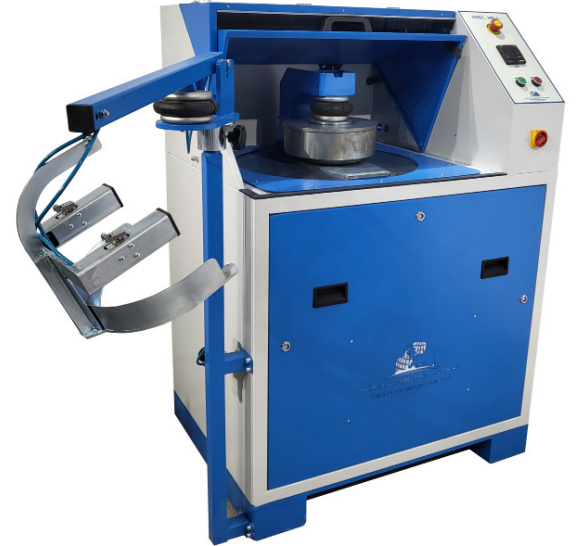
HR-M6500 & HR-M6002