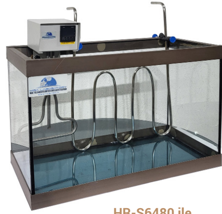
HR-S6480 ile HR-S6450/1 HR-S6470/2