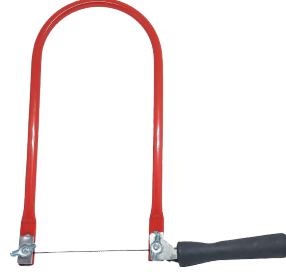
HR-G0753 & HR-G0754