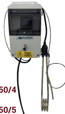
HR-C0450/4 ile HR-C0450/5