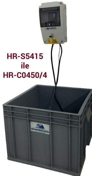
HR-S5415 ile HR-C0450/4