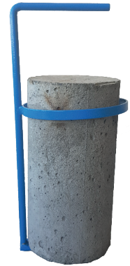
HR-C0249 with sample