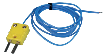
HR-C0960 ile HR-C0961