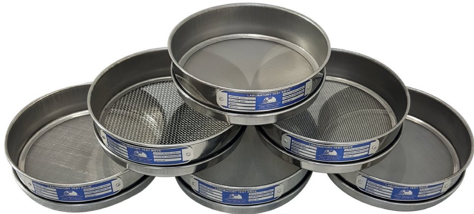
Ø200 x 50 mm Tel Örgülü Elekler