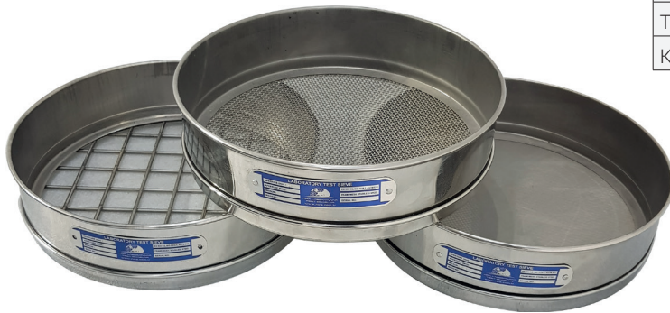
Ø300 x 50 mm Tel Örgülü Elekler