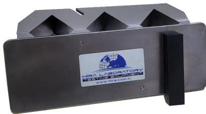
HR-CE9555 & HR-CE9550/1 & HR-CE9550/2