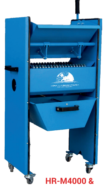
HR-M4000 & HR-M4000/1

Tekerlekler, opsiyonel olarak mevcuttur ve ayrıca sipariş edilmelidir.